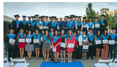
Los graduados del Talent Graduate Program.

La entidad graduó a 40 recién licenciados que han formado parte de la primera edición del Talent Graduate Program (TGP). En el acto de celebración, conocido como Talent Day, también se dio la bienvenida a otros 40 jóvenes para iniciar la segunda edición. Los candidatos seleccionados seguirán un exhaustivo itinerario formativo entre diferentes puestos y departamentos del banco durante los próximos dos años. El TGP es una iniciativa que recluta jóvenes recién licenciados de alto potencial.