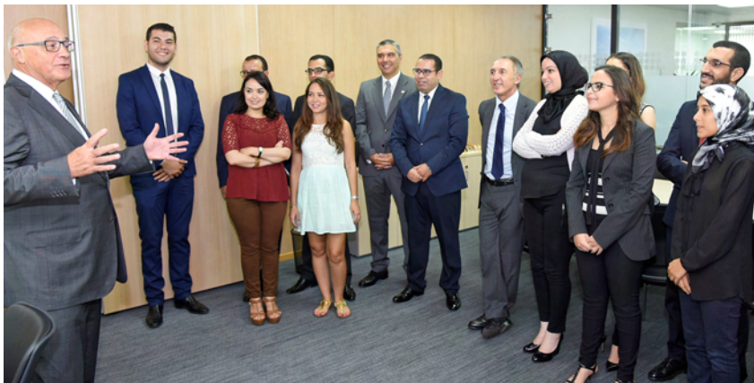
Josep Oliu, junto a la plantilla de la oficina de Banco Sabadell en Casablanca.

El presidente Josep Oliu visitó la oficina que tiene la entidad en Casablanca para conocer de primera mano las últimas ampliaciones realizadas y saludar a su equipo profesional. Su estancia en Marruecos sirvió también para participar en un encuentro organizado por la Fundación Tanja y el diario L'Economiste. El presidente intervino como ponente y expuso la evolución de la economía y del sector financiero de España durante la crisis, junto a las expectativas y proyectos de Banco Sabadell en Marruecos. El ministro de Economía y Finanzas del país magrebí,