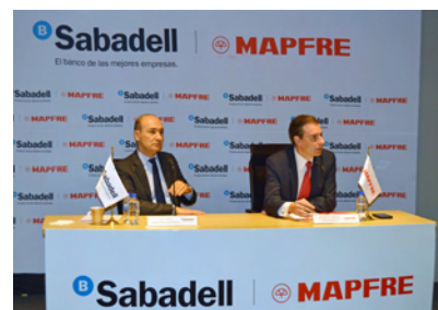
Directivos de Mapfre y Banco Sabadell, presentando el acuerdo en México.

Banco Sabadell y Mapfre firmaron en noviembre pasado una alianza en México para ofrecer servicios financieros y de protección integral mediante la venta de seguros y de aquellos servicios dirigidos a los clientes de la entidad. El objetivo de esta alianza es proporcionar protección integral a través de planes de financiación y cobertura de seguros acorde a las necesidades de cada cliente.