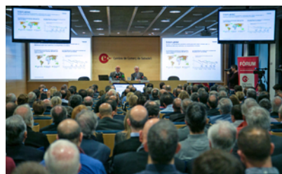
Más de 200 empresarios en la conferencia de Oliu en la Cámara de Comercio de Sabadell.

El presidente de Banco Sabadell, Josep Oliu, presentó a mediados de enero en la Cámara de Comercio de Sabadell su visión del presente ejercicio en una conferencia titulada “Perspectivas económicas 2017”. Ante la asistencia de más de 200 empresarios, señaló que, en líneas generales, las previsiones son mejores que las de años anteriores, aunque precisó que “el crecimiento global seguirá siendo reducido, pero por primera vez desde que estalló la crisis no sorprenderá a la baja”. Sobre la economía española, el