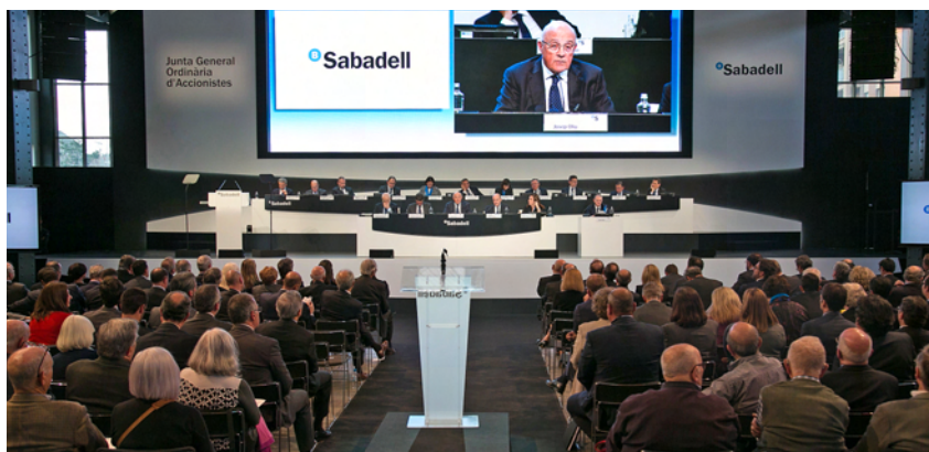
Imagen de la celebración de la Junta General de Accionistas que tuvo lugar en Sabadell.

La Junta General de Accionistas del banco aprobó el pasado 30 de marzo la gestión y los resultados del ejercicio 2016, que cerró con unos resultados netos de 710,4 millones de euros, y acordó destinar 279,7 millones de euros a la retribución al accionista (0,05 euros por título).