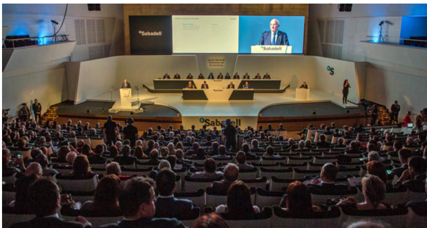
Alicante acogió la Junta General de Accionistas en el mes de abril.

La Junta General Ordinaria de Accionistas del banco, celebrada en Alicante el pasado 19 de abril, aprobó la gestión y los resultados de 2017, que cerró con un beneficio neto atribuido de 801,5 M€, y acordó destinar 281,3 M€ a la retribución al accionista de un dividendo complementario por un importe de 0,05 euros por título. Habida cuenta de que en diciembre ya se abonó la cantidad de 0,02 euros por acción, la remuneración total al accionista a cargo de 2017 asciende a 0,07 euros por título, lo que supone un pay out del 49%, 393 M€.