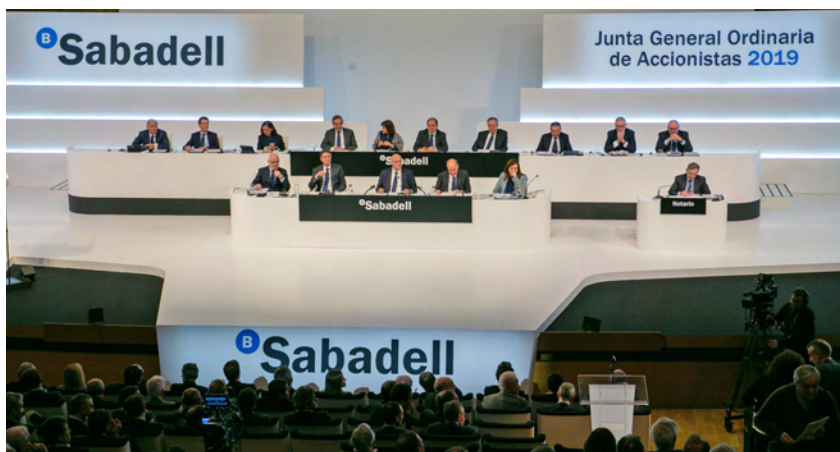
Instantánea de la celebración de la Junta General Ordinaria de Accionistas.

La Junta General de Accionistas de Banco Sabadell, celebrada con carácter ordinario el pasado 28 de marzo en Alicante, aprobó mayoritariamente la gestión y los resultados del 137º ejercicio de la entidad, que cerró con 328,1 millones de euros de beneficio, y la distribución de un dividendo total bruto de 0,03 euros en efectivo por acción correspondiente al ejercicio 2018.