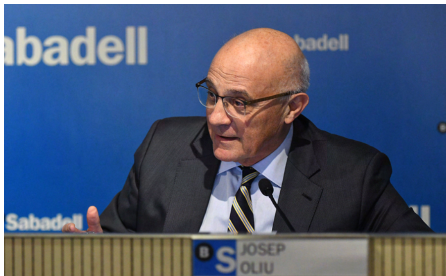
El presidente Josep Oliu, durante su intervención en la rueda de prensa de presentación de resultados.

Banco Sabadell gana 801,5 millones de euros, un 12,8% más