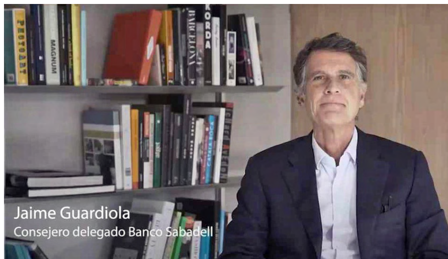
La presentación de resultados se celebró de forma telemática.